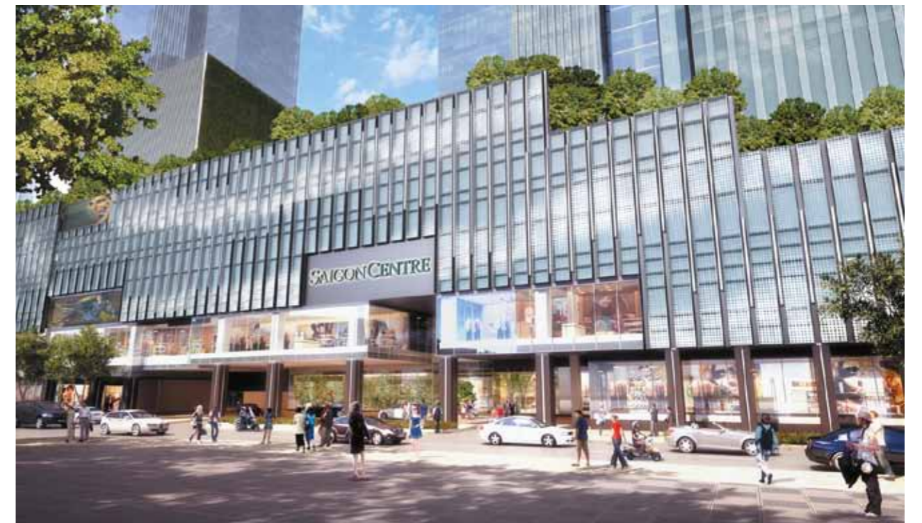
Phối cảnh dự án Saigon Centre (giai đoạn 2)