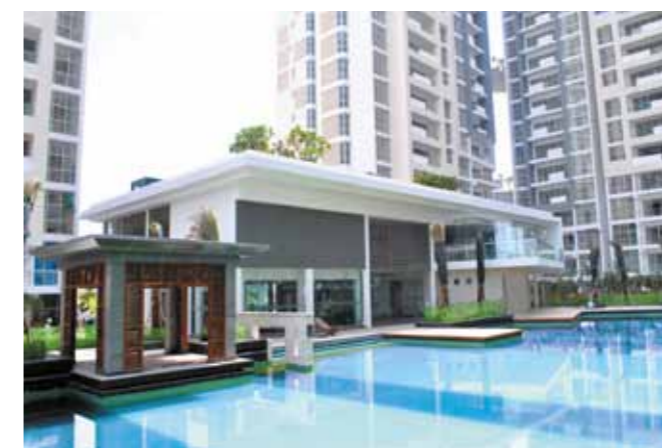
Hồ bơi và nhà câu lạc bộ