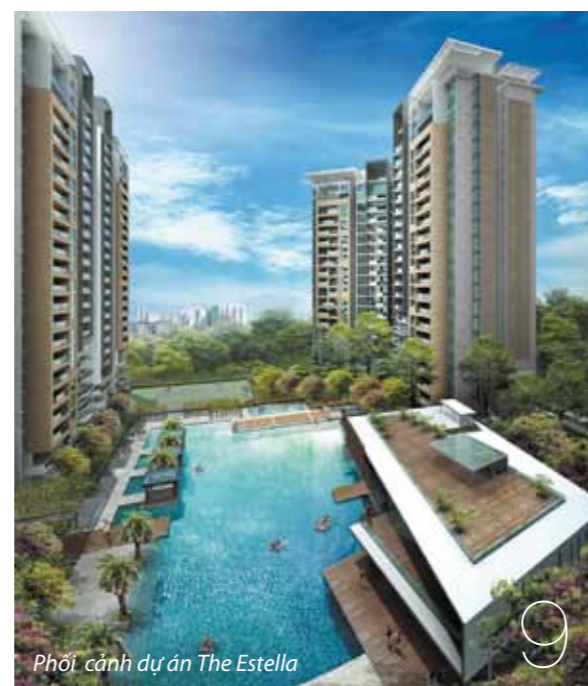
Phối cảnh dự án The Estella