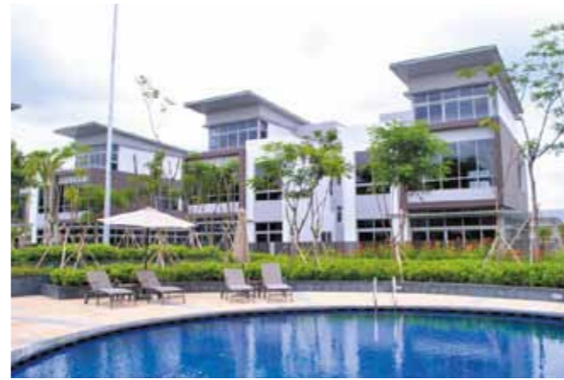
Khu biệt thự gần hồ bơi

Văn phòng kinh doanh dự án Riviera Cove Phòng 6, Lầu 7, Saigon Centre 65 Lê Lợi, Quận 1, Tp.HCM Tel: (848) 38 989 999 - Fax: (848) 39 144 553 Email: info@rivieracove.com.vn - www.rivieracove.com.vn