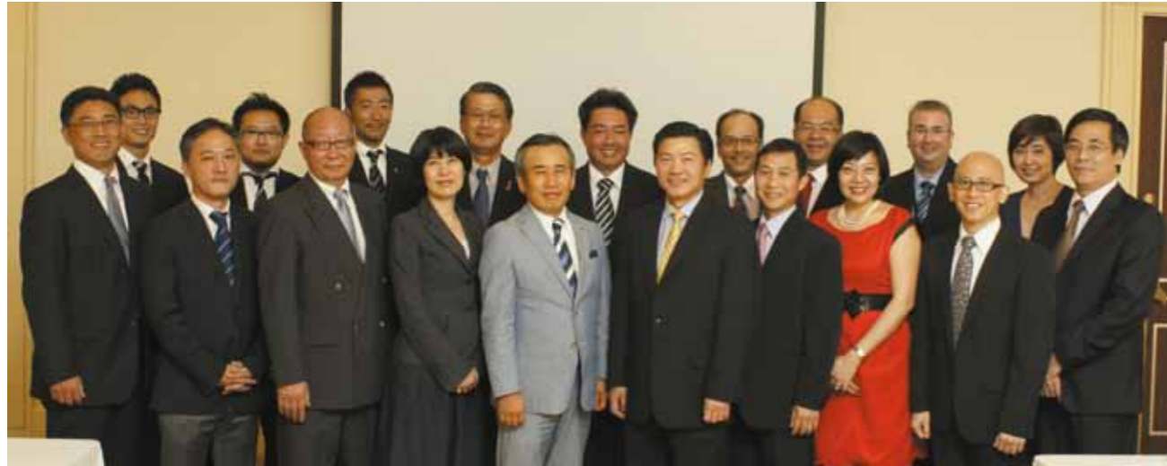
Hội đồng quản trị của Takashimaya, Toshin và Keppel Land WATCO