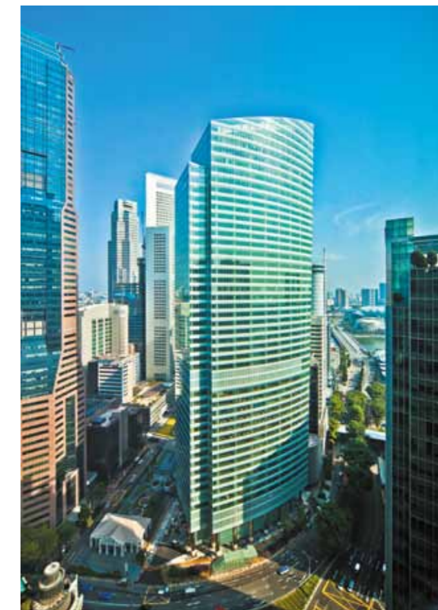
Ocean Financial Centre đạt được đánh giá 5 sao - số điểm cao nhất trong ba hạng mục của Giải thưởng Bất động sản quốc tế 2012

Tòa tháp văn phòng Hạng A cao 43 tầng này đã được trao tặng Giải thưởng Trung tâm thương mại cao tầng tốt nhất, Dự án cao ốc văn phòng tốt nhất và Kiến trúc cao ốc văn phòng tốt nhất tại khu vực Châu Á Thái Bình Dương. Dự án Riviera Point tại Quận 7, Tp. Hồ Chí Minh cũng đã được tuyên dương xuất sắc cho hạng mục "Dự án phức hợp" tại Việt Nam tại giải thưởng này.