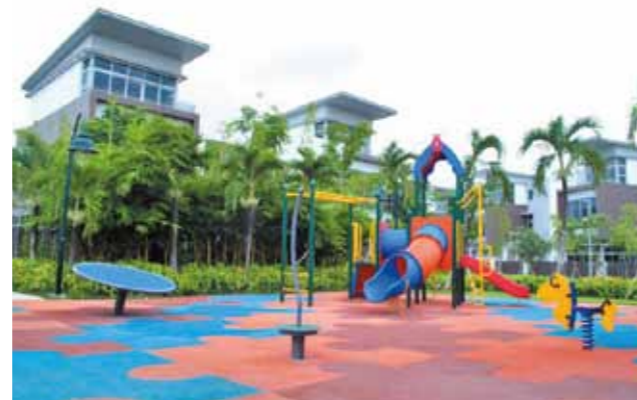
Sân chơi trẻ em