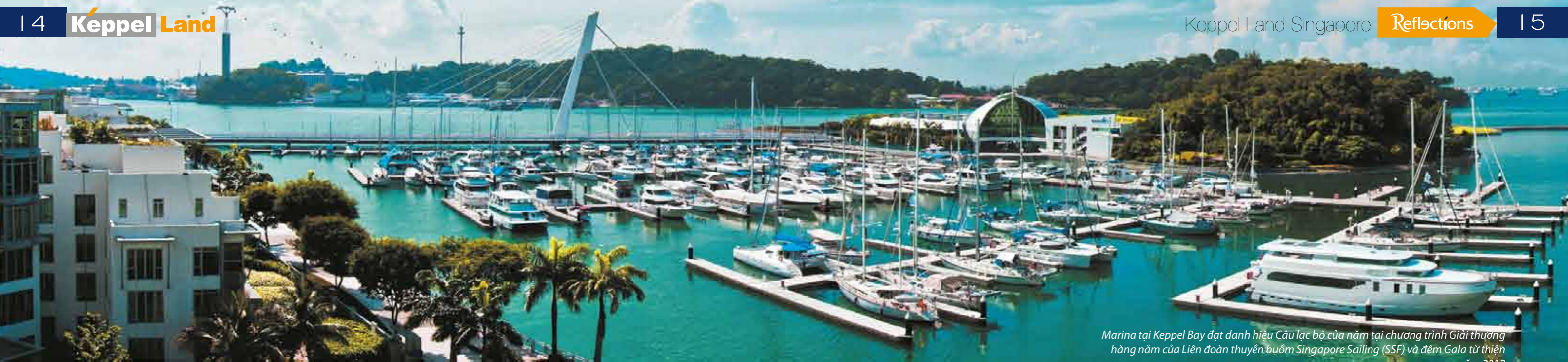
Marina tại Keppel Bay đạt danh hiệu Cầu lạc bộ của năm tại chương trình Giải thưởng hàng năm của Liên đoàn thuyền buồm Singapore Sailing (SSF) và đêm Gala từ thiện

triển và xây dựng, về việc đảm bảo quyền và lợi ích của cộng đồng và các tác động có liên quan đến môi trường, cũng như khả năng tài chính và tiếp thị đặc biệt xuất sắc. Đây là giải thưởng đề cao các doanh nghiệp chủ chốt trong lĩnh vực xây dựng và tôn vinh các chủ đầu tư và công ty kiến trúc hàng đầu trong khu vực Đông Nam Á. Giải thưởng được trao cho các công ty có ảnh hưởng lớn đối với môi trường xây dựng tương lai, giúp thị trường hiểu rõ hơn vai trò quan trọng của những công ty này và ảnh hưởng của họ, cả về mặt xã hội và môi trường.