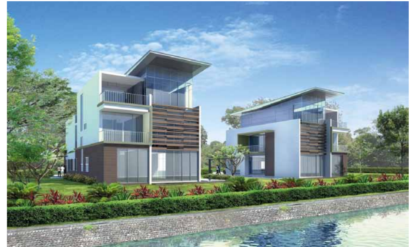
Phối cảnh biệt thự tại dự án

Nối tiếp thành công của dự án Riviera Cove, Quận 9, Tp. Hồ Chí Minh, Keppel Land đang chuẩn bị giới thiệu dự án biệt thự khác cũng tại Quận 9, tọa lạc tại phường Phú Hữu. Dự án này bao gồm 131 biệt thự cao cấp trải dài trên diện tích rộng 9,8 ha.