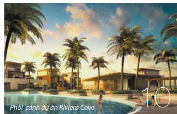
Phối cảnh dự án Riviera Cove