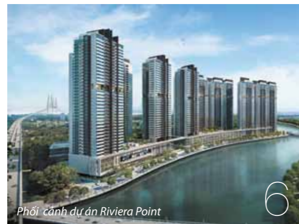
Phối cảnh dự án Riviera Point

13 Những dấu ấn nổi bật Mark of distinction