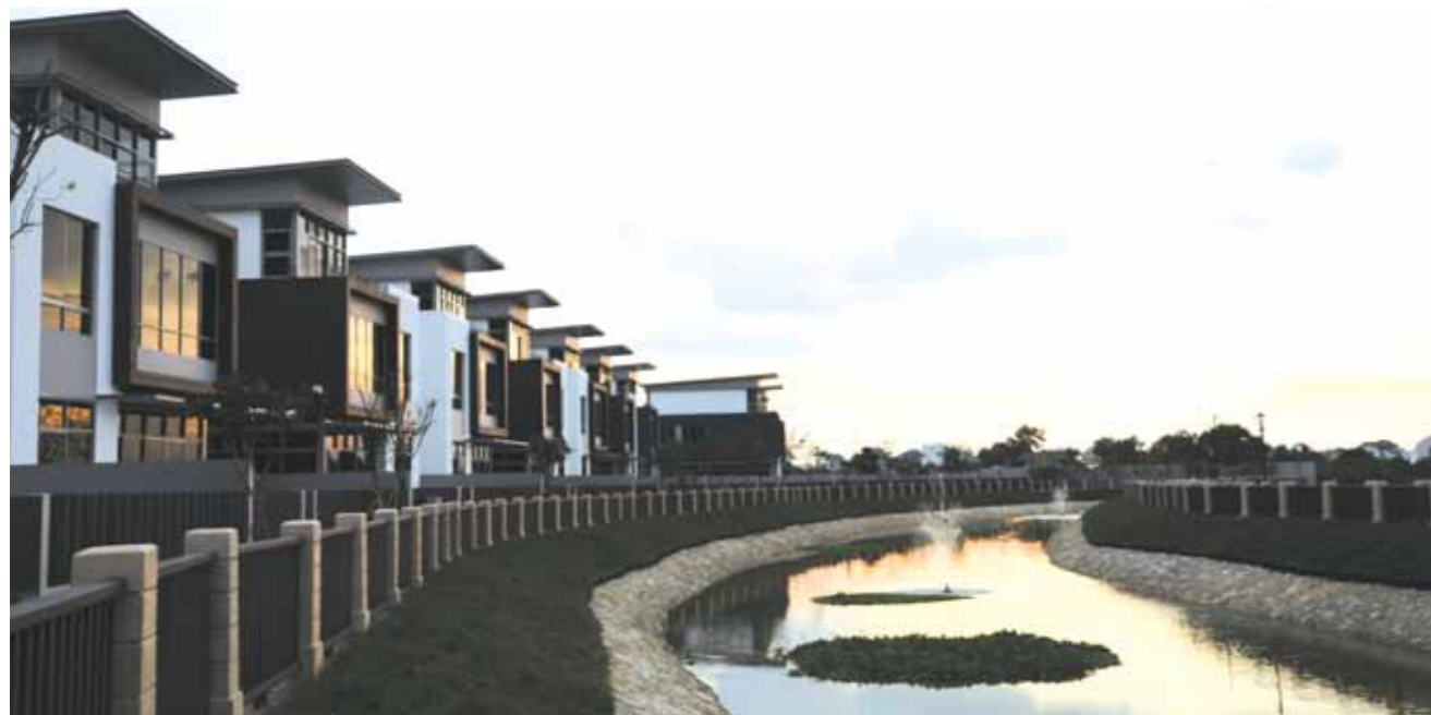
Khu biệt thự ven sông